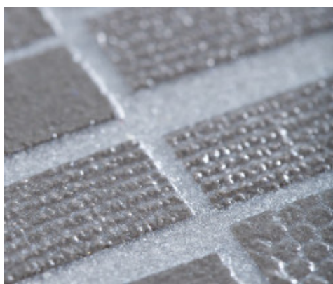
Efekt końcowy Kerapoxy Easy Design 700 + Mapecolor Metallic Shining