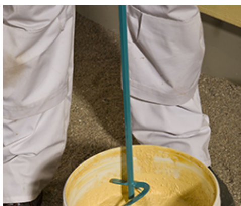
Tynk przed nakładaniem wymieszać do jednolitej konsystencji

Sisicolor Tonachino należy nanosić na podłoże za pomocą gładkiej pacy ze stali nierdzewnej na grubość kruszywa. Właściwą fakturę uzyskuje się zacierając tynk bezpośrednio po nałożeniu ruchami okrężnymi pacą z tworzywa sztucznego. W trakcie nakładania należy zapewnić właściwą organizację pracy uzależnioną od warunków atmosferycznych. Prace tynkarskie na jednej wyodrębnionej powierzchni należy prowadzić w sposób ciągły, przy użyciu tych samych narzędzi w ten sam sposób. Tynk przeznaczony jest także do nakładania mechanicznego przez natrysk pneumatyczny. Wykonaną wyprawę należy chronić przed bezpośrednim działaniem opadów atmosferycznych, aż do pełnego związania. Renowację tynku można prowadzić przez malowanie farbą Sisicolor Pittura lub Silancolor Pittura .