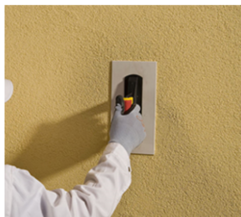
Tynk zacierać pacą PVC