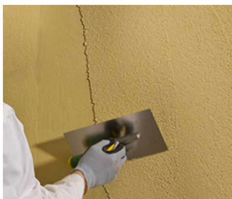
Tynk nakładać gładką pacą stalową na grubość kruszywa