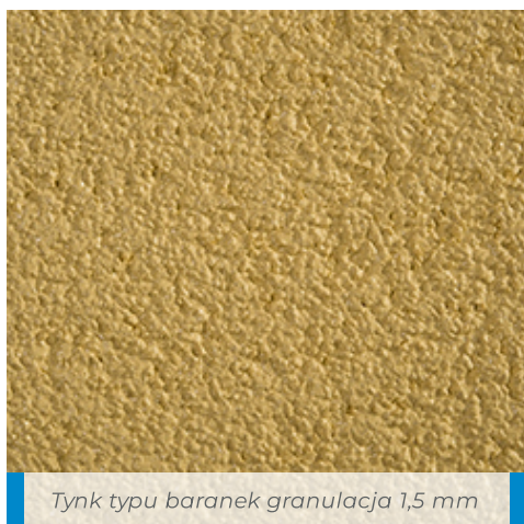
Tynk typu baranek granulacja 1,5 mm