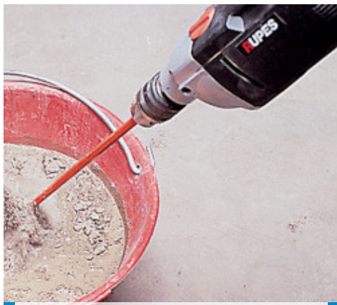
Przygotowanie zaprawy Adesilex P4