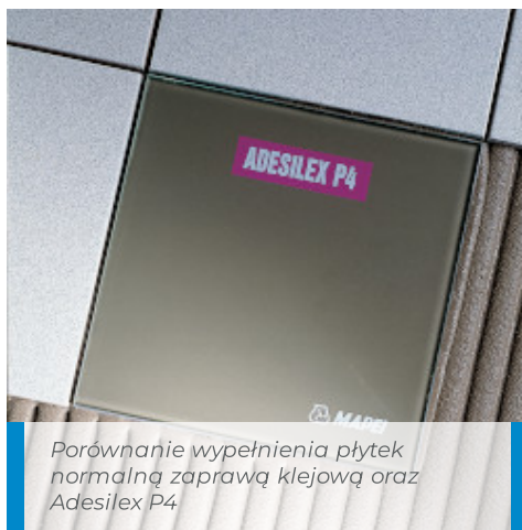
Porównanie wypełnienia płytek normalną zaprawą klejową oraz Adesilex P4