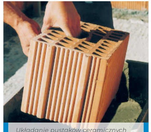
Układanie pustaków ceramicznych przy użyciu Adesilex P4