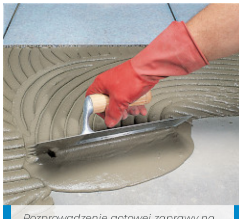
Rozprowadzenie gotowej zaprawy na podłożu za pomocą szpachli zębatej