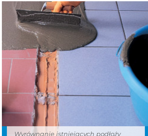
Wyrównanie istniejących podłoży ceramicznych przy użyciu Adesilex P4