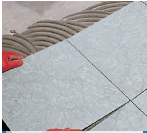
Montaż płytek z gresu porcelanowego