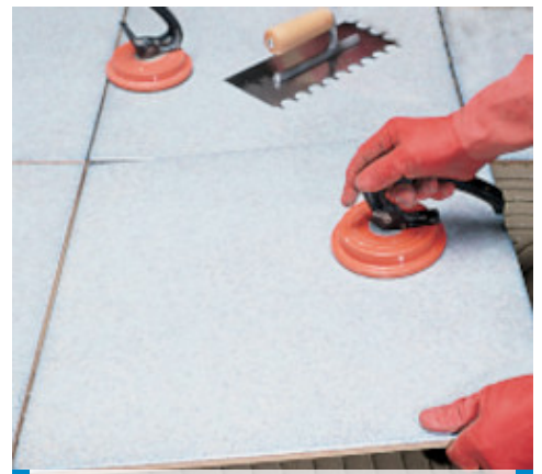
Montaż płytek dużego formatu