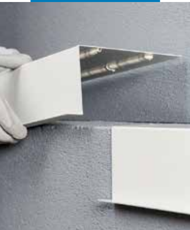
Elastyczne łączenie elementów