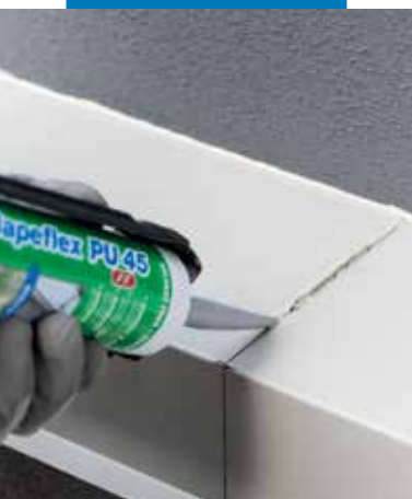
Elastyczne uszczelnianie złączy